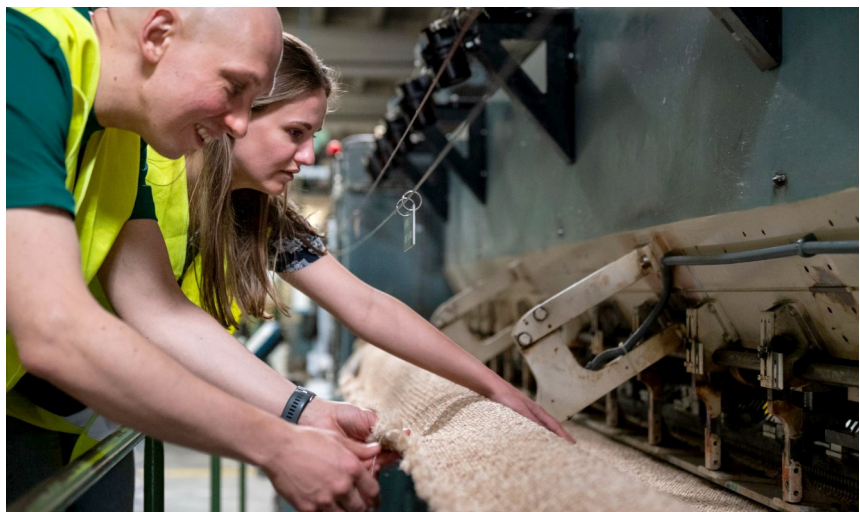
NetBid et Gordon Brothers gèrent le processus de A à Z: de l'inventaire au démontage et à la livraison