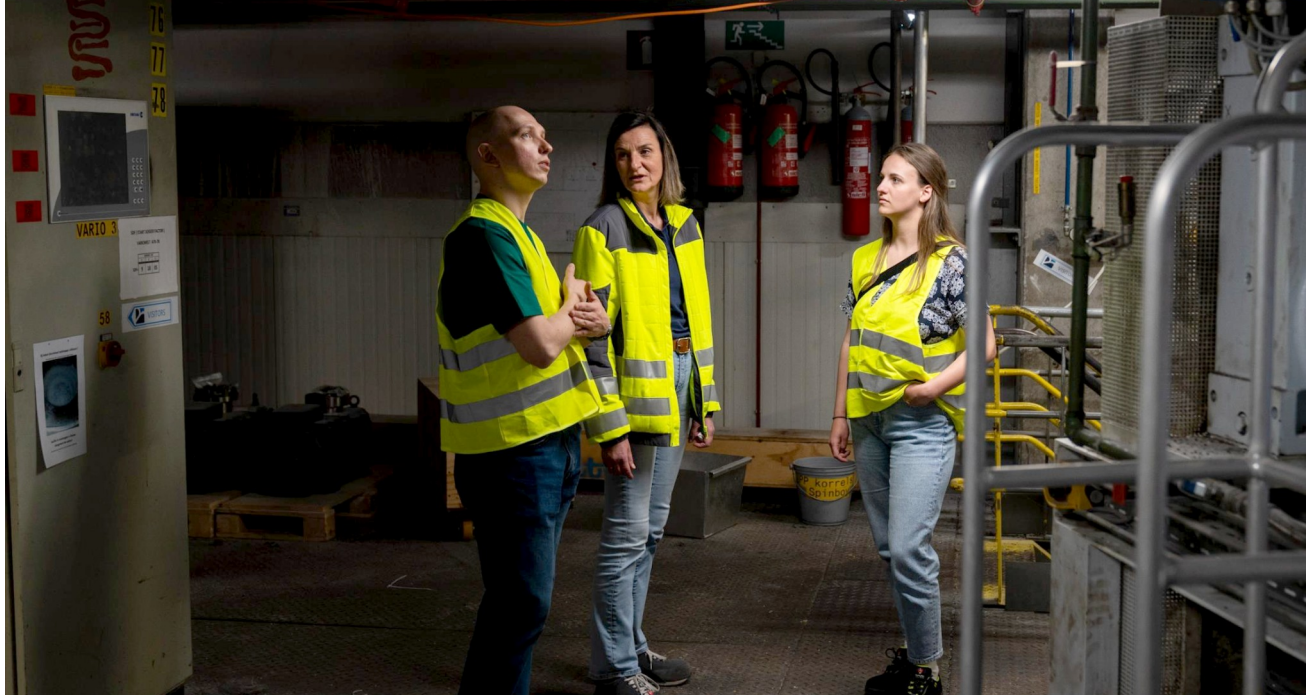
NetBid et Gordon Brothers disposent d'un vaste réseau international, ce qui constitue un atout majeur lors de la vente d'actifs